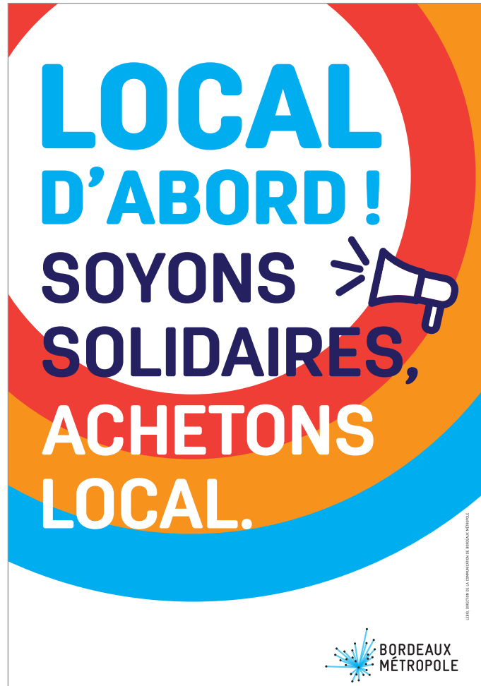
Visuel de communication pour encourager l'achat de proximité.