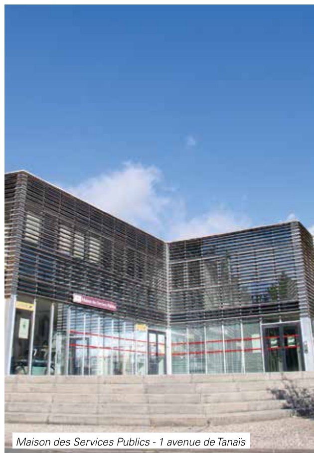
Maison des Services Publics - 1 avenue de Tanais

À partir du 2 novembre vous pourrez aussi y faire établir la carte Max pour les 11-15 ans (plus d'infos sur le site de la ville) ou la carte jeune pour les 11-26 ans, mais aussi retirer vos sacs pour le ramassage des déchets verts .